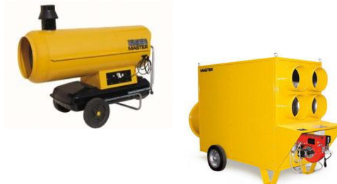
BV 310/470/690 FS